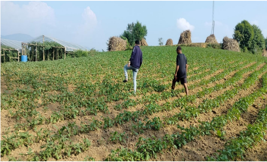
नमोबुद्ध नगरपालिकामा संचालित आलु पकेटको झलकहरू...