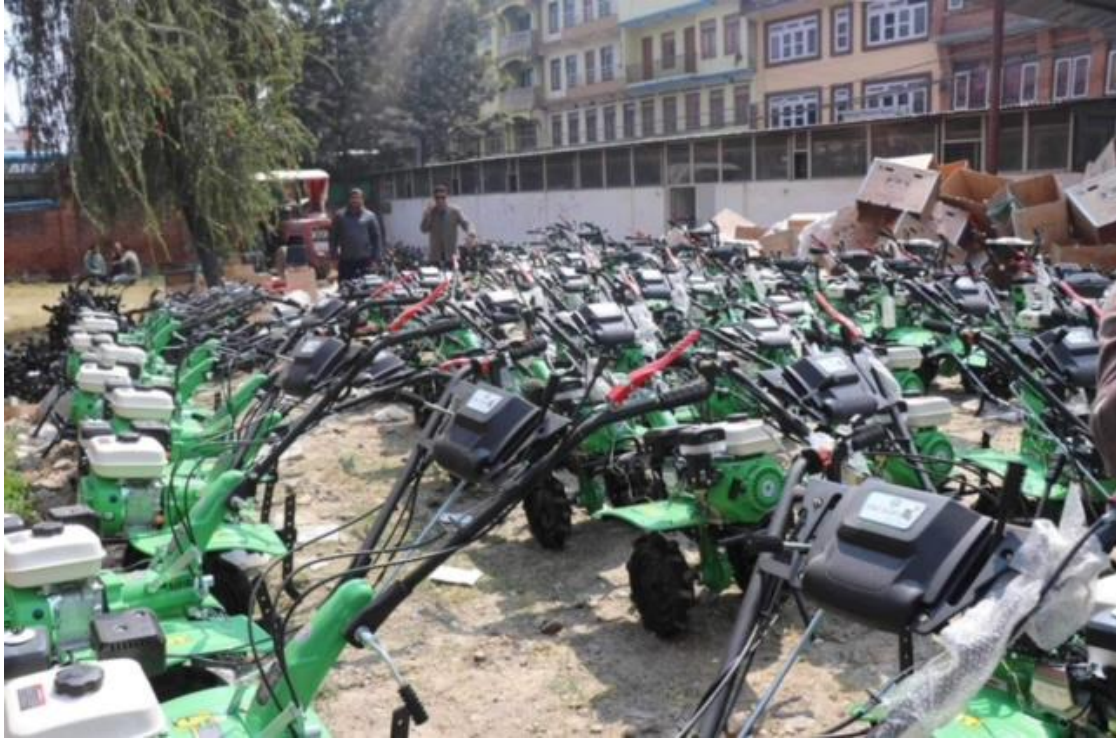
चित्र: बनेपा नगरपालिका अन्तर्गत आलु पकेटद्वारा मिनिटिलर वितरण गरिएको झलकहरू..