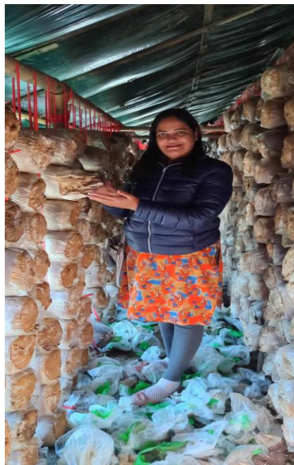
चित्र: धुलिखेल नगरपालिकामा संचालित तरकारी र च्याउ पकेटका झलकहरू...