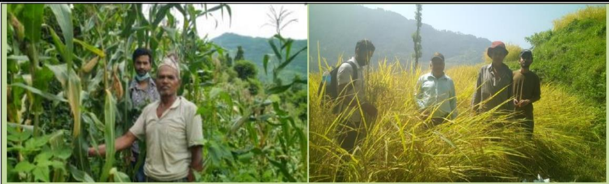
खडा वाली निरिक्षण हुँदै