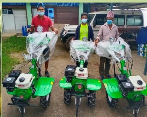
मीनी टिलर वितरण