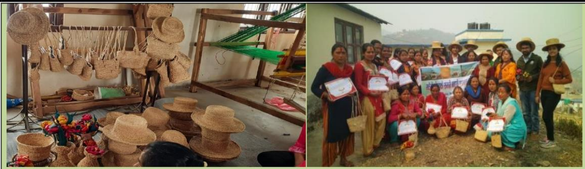
मकैको खोस्टाबाट निर्मित हस्तकलाका सामग्रीहरु