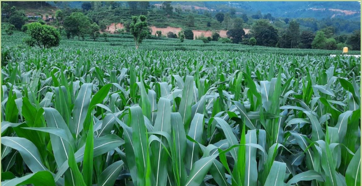
वर्णशंकर मकैको वृहत उत्पादन, इन्द्रावती - ११