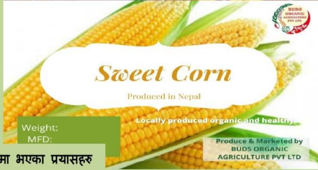
ब्राण्ड प्रवर्द्धन कार्यमा भएका प्रयासहरु