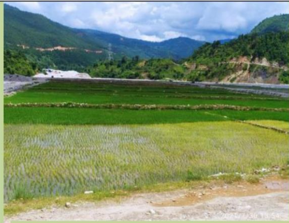
चकलाबन्दी- इन्द्रावती-११, माझी बगर