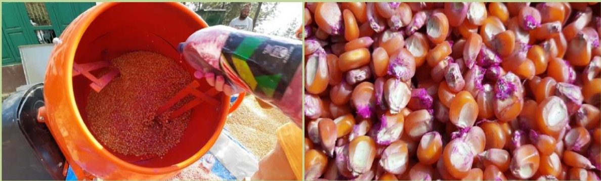
मकै बीउलाई थिराम द्वारा उपचार गरिदै