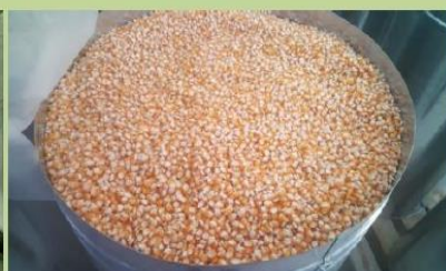
बीउ मकैलाई मेटल वीनमा भण्डारण गरिएको