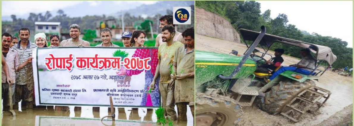
धान रोपाई कार्यक्रम पाँचखाल -०२