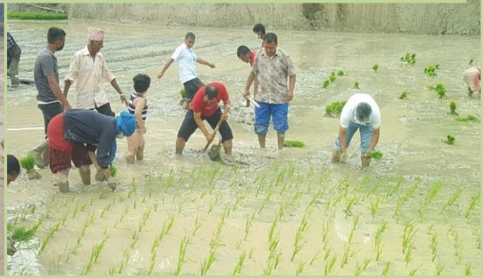
धान रोपाई कार्यक्रम हर्षे खण्ड