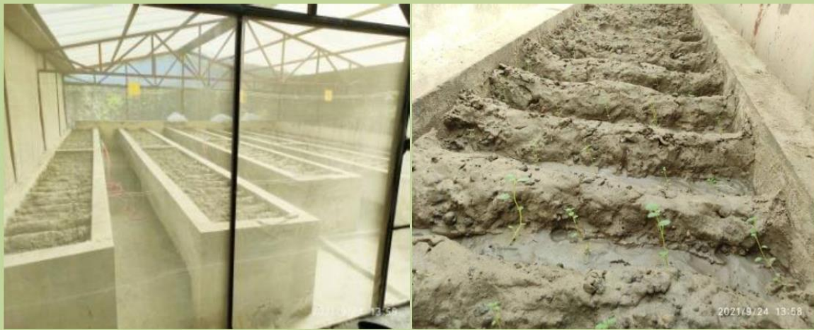
स्क्रीन हाउस भित्र P.B.S. MOTHER STOCK PLANT तयार हुँदै