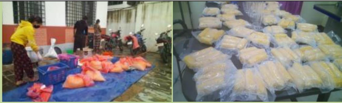
स्वीट कर्न मकैको प्रशोधन गरिदै