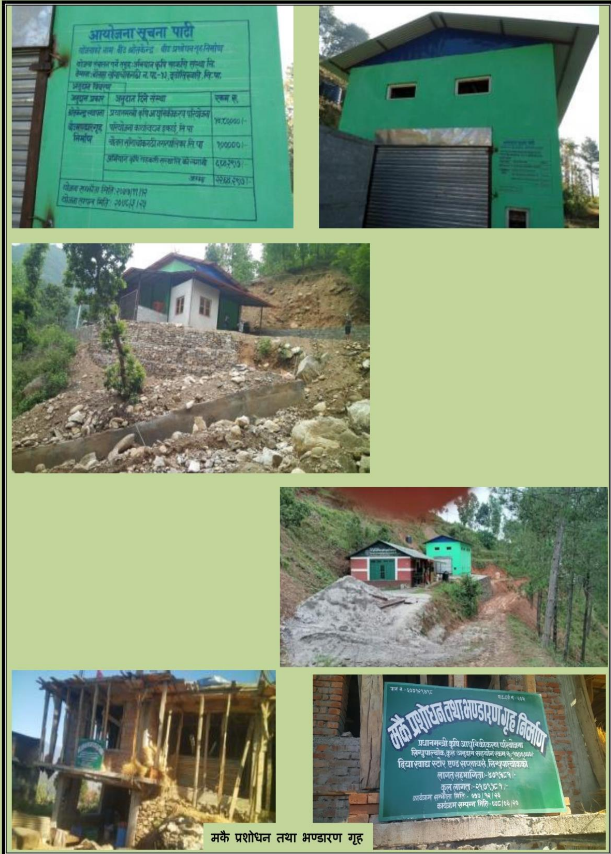
मकै प्रशोधन तथा भण्डारण गृह