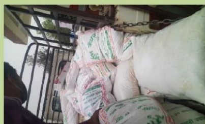
बीउ उत्पादन हुने क्षेत्रको माटो सुधार्न सुक्ष्म खाद्यतत्वको प्रयोग