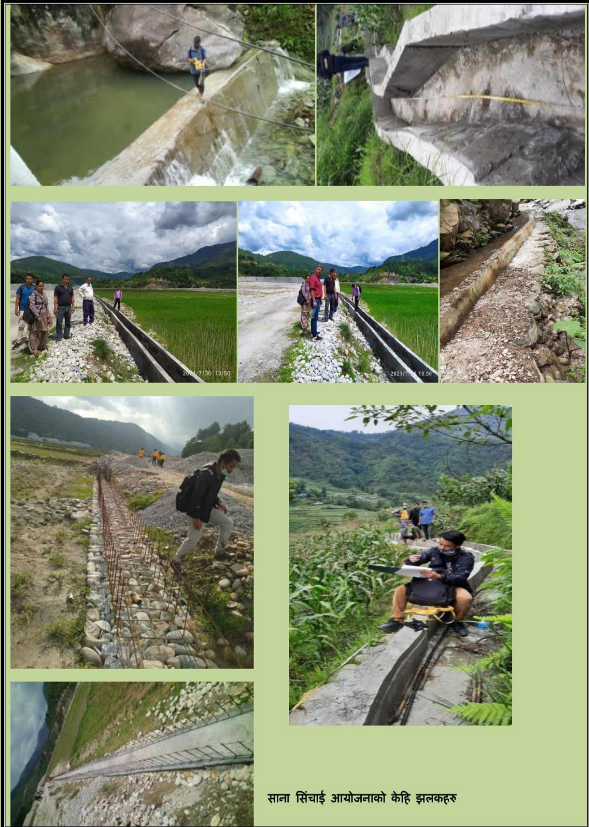
साना सिंचाई आयोजनाको केहि झलकहरु