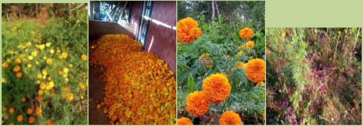
मकै संग अन्तर वाली लगाइएको फुलहरु