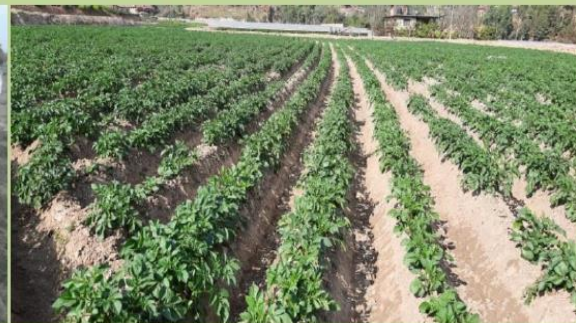
आलु रोप्ने मेशिनको सफल