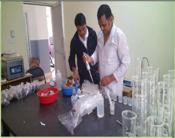
माटो परिक्षण कार्य हुँदै