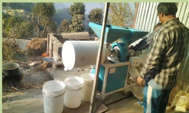
मकैको च्याँखला बढाउने मेशिन