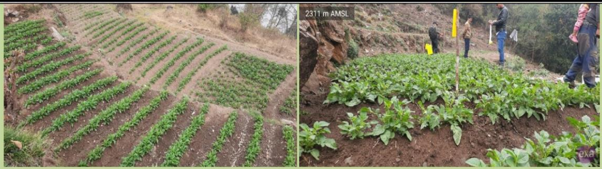
रोजिटा आलुको श्रोत उत्पादन