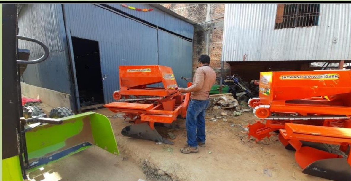
कष्टम हायरिड सेन्टर, पाँचखाल-२