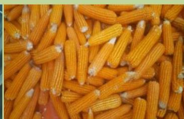
रामपुर कम्पोजिट मूल बीउ मकै