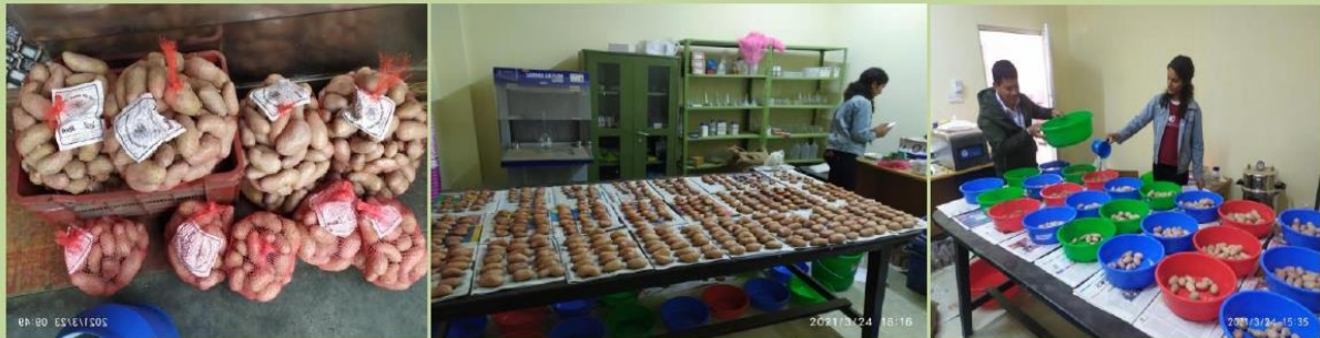
आलुको विभिन्न जातहरूको जातिय उत्पादन प्रदर्शनीका लागि बीउ उपचार तथा तयार गरिदै