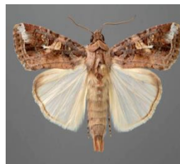
अमेरिकन फौजी किरा

मड्सिर महिनामा आलु बालीमा गरिने प्रमुख कार्यहरु: