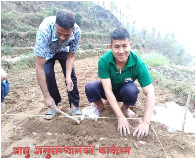
आलु अनुसन्धानको कार्यक्रम