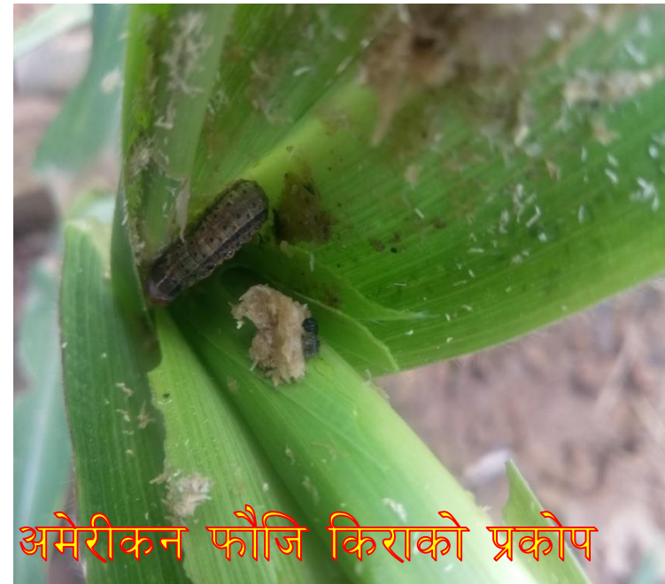
मकैमा अमेरिकन फौजि किराको प्रकोप