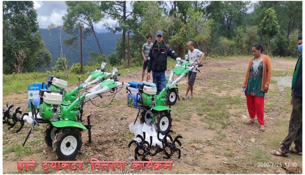
हाते ट्र्याक्टर वितरण कार्यक्रम