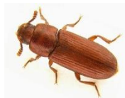
पीठोमा लाग्ने रातो खपटे

कार्तिक महिनामा आलु वालीमा गरिने प्रमुख कार्यहरु: तराईमा