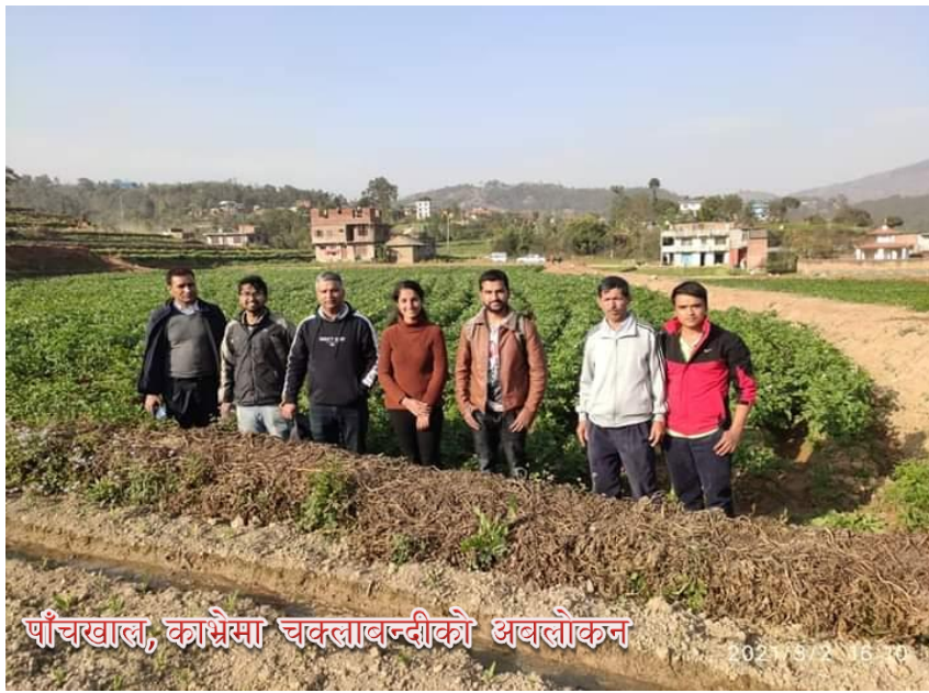
पाँचखाल, काभ्रेमा चकलावन्दीको अवलोकन