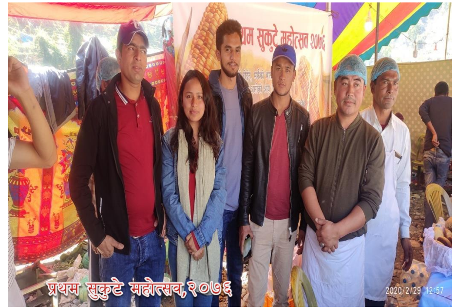
प्रथम सुकुटे महोत्सव, २०१६