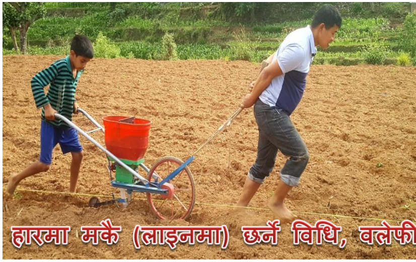
हारमा मकै (लाइनमा) छर्ने विधि, वलेफी