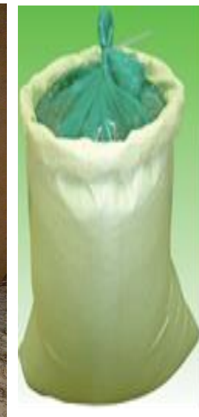
प्लाष्टिक कोटेड सुपरग्रेन हर्मेटिक ब्याग