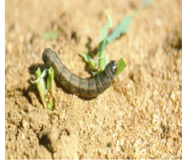
फेद कटुवा किरा